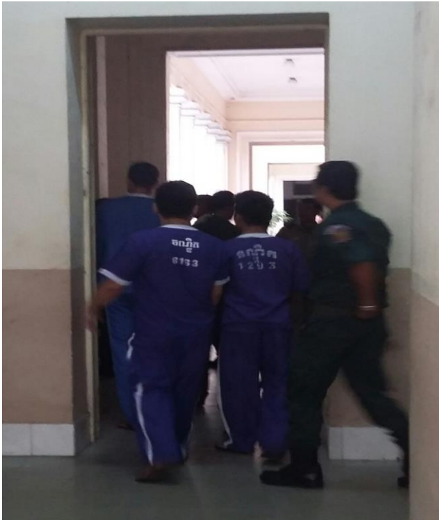
ម.ស.ម.កះ ជនជាប់ចោទក្នុងឯកសណ្ឋានទណ្ឌិត

អាសន្ន និងទណ្ឌិតត្រូវតែពាក់អាវដែលបង្ហាញពីកន្លែងជាប់ឃុំខ្លួនរបស់ពួកគេបង្ហាញពីការប្រព្រឹត្តិដែលប៉ះពាល់ដល់កិត្តិយសរបស់ពួកគេដែរ” និងថាការតម្រូវឲ្យពាក់ឯកសណ្ឋានបែបនេះ នៅអំឡុងពេលជំនុំជម្រះអាចរំលោភបំពានលើសិទ្ធិនៃការសន្មតទុកជាមុនថាគ្មានទោស។ 5